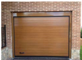
ACANALADA MADERA CLARA