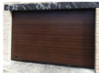
ACANALADA MADERA OSCURA