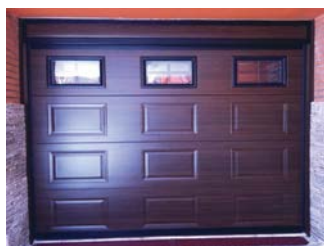
CUARTERON MAD. OSCURA